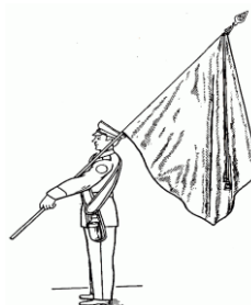
Рис. 62. Положение Боевого знамени